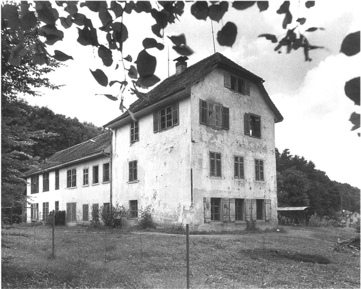
Die ehemalige Taubstummen- anstalt, hier kurz vor dem Abbruch, wich 1956 dem Kre- matorium beim Friedhof Lie- benfels.