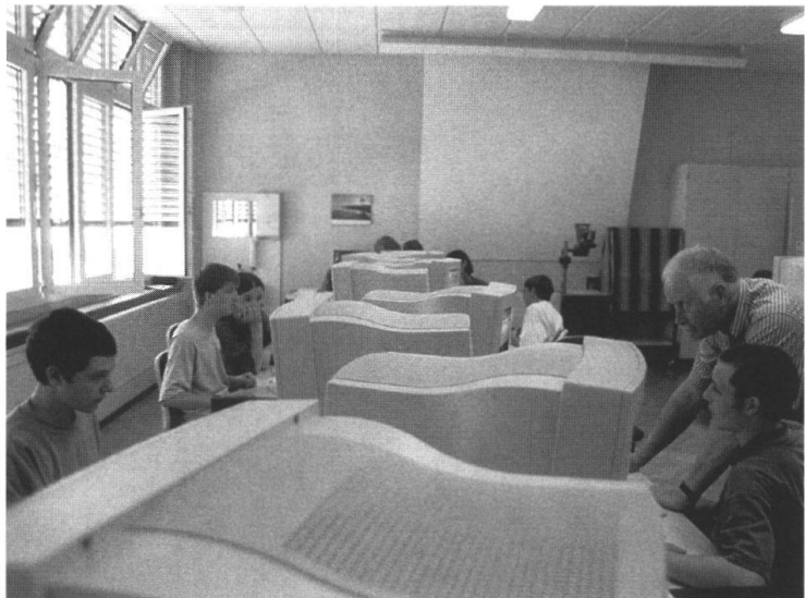
Der Pioniergeist der Firma überträgt sich auf die Lehrlingsausbildung: Lehrlinge beim Turnen im Jahr 1933 und Lehrlinge während des Informatikunterrichts 1998.