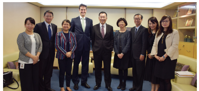
顧主任委員（左 5）接見澳洲辦事處高代表戈銳 (Mr. Gary Cowan)（左 4）。

澳洲辦事處高代表戈銳 (Mr. Gary Cowan) 於 108 年 5 月 7 日受到金管會顧主委熱情接見。雙方就經濟與金融等議題廣泛交換意見。