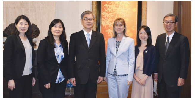
金管會黃副主任委員（左 3）宴請盧森堡台北辦事處處長（左 4）一行。

金管會黃副主任委員天牧於 108 年 6 月 5 日宴請盧森堡台北辦事處處長一行，雙方就盧盧雙邊深化金融合作等議題廣泛交換意見。