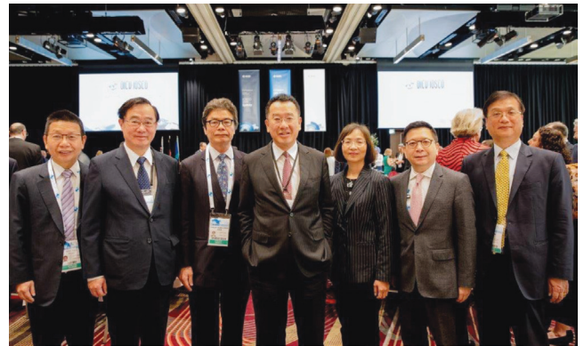
金管會顧主任委員（左 4）108 年 5 月 13 日至 17 日率團赴澳洲雪梨出席第 44 屆國際證券管理機構組織 (IOSCO) 年會。

國際證券管理機構組織（簡稱 IOSCO）第 44 屆年會於 108 年 5 月 13 日至 17 日在澳洲雪梨舉行，我國由金管會顧主任委員立雄率團參加。我代表團於本屆年會相關活動及專題論壇，分別就金融指標之改革及監管、如何兼顧金融科技創新與市場穩定及投資人保護、永續金融與監理法規，以及金融業之未來發展與監理思維等議題深入討論，並專題介紹我國推動公平待客原則之進程。