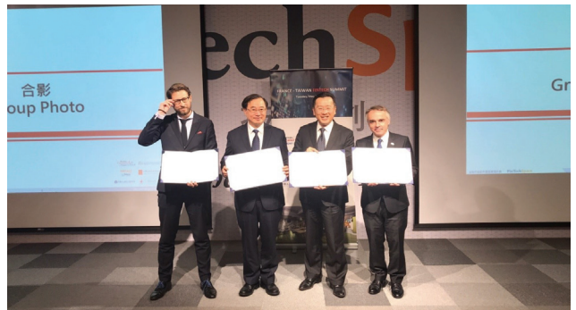
金管會顧主任委員（左 3）見證金融總會許理事長（左 2）與法國在臺協會紀主任（左 4）以及與巴黎企業發展署代表（左 1）分別簽署金融科技合作協議。

金管會顧主任委員立雄於 108 年 5 月 28 日假金融科技創新園區見證金融總會與法國在臺協會以及與巴黎企業發展署分別簽署金融科技合作協議。