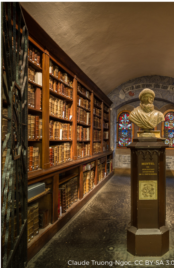
Claude Truong-Ngoc, CC BY-SA 3.0